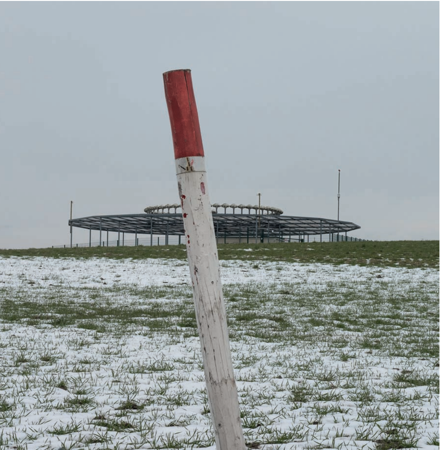
Το χρυσό βραστάρι, Erpeldange, 2018