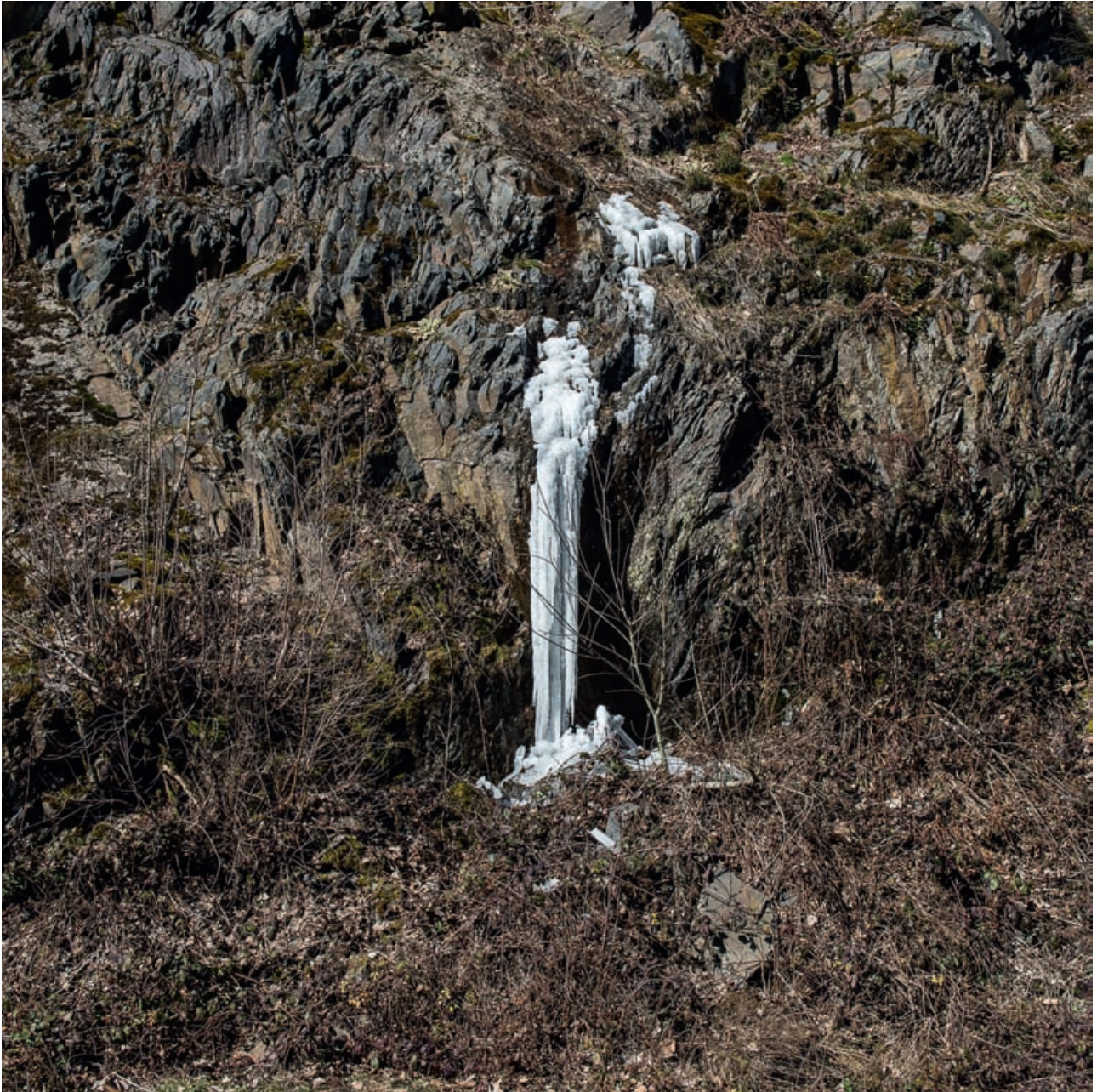
Παγωμένη πηγή στις παρυφές επαρχιακού δρόμου, Grosbous, 2018