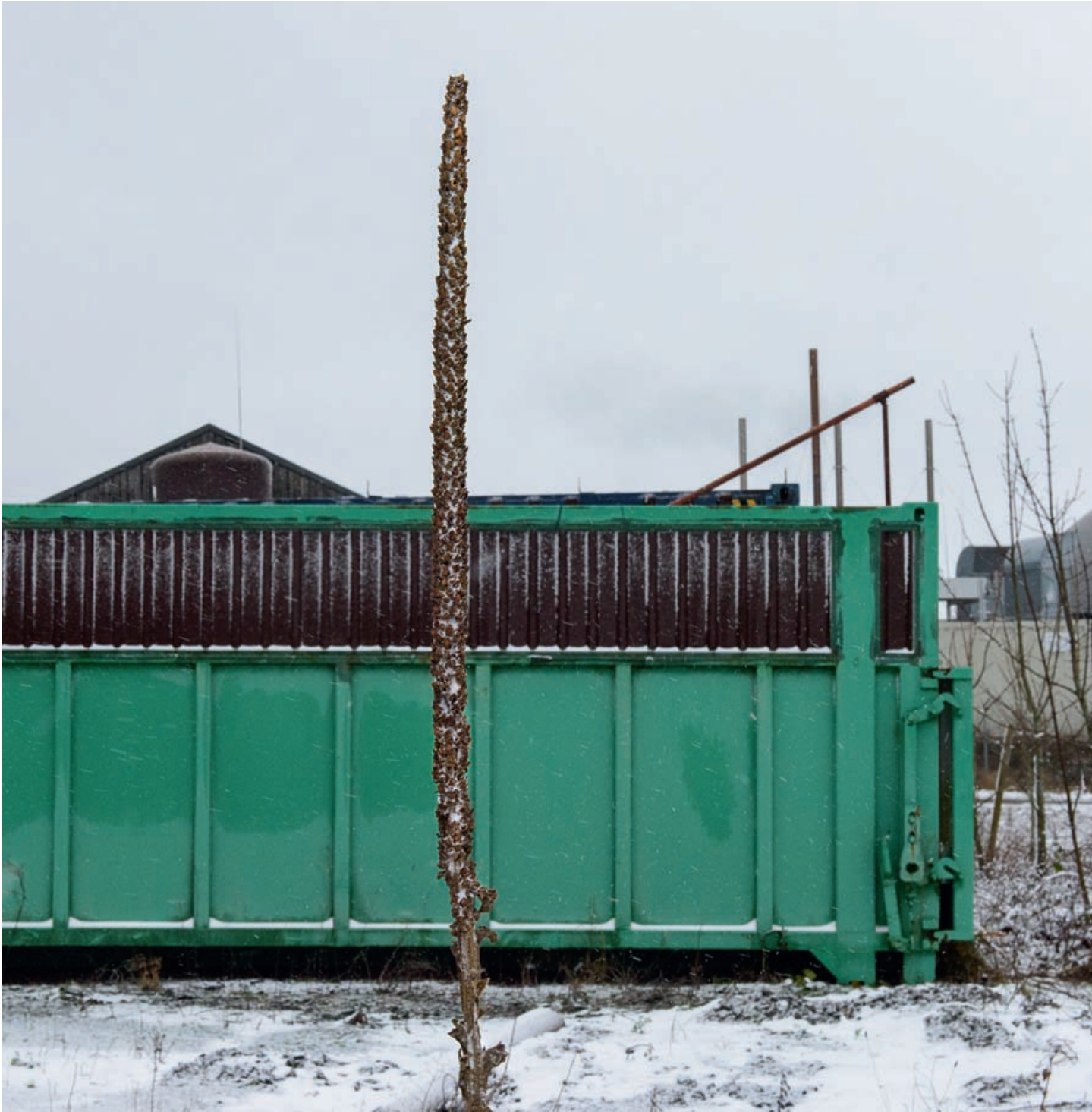
Φάρμα, Hoscheid, 2018