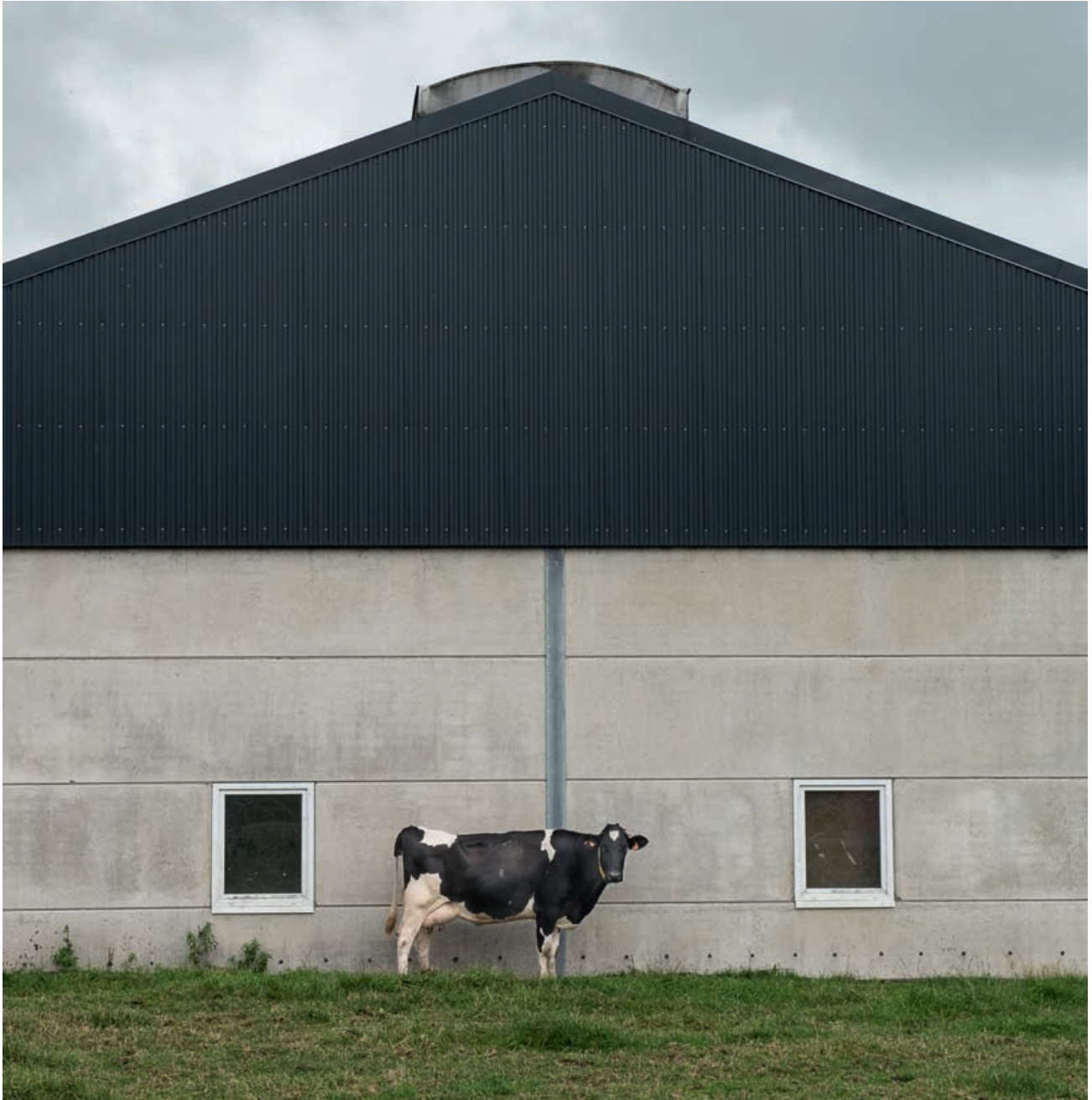
Η τέλεια αγελάδα, Roedt, 2018