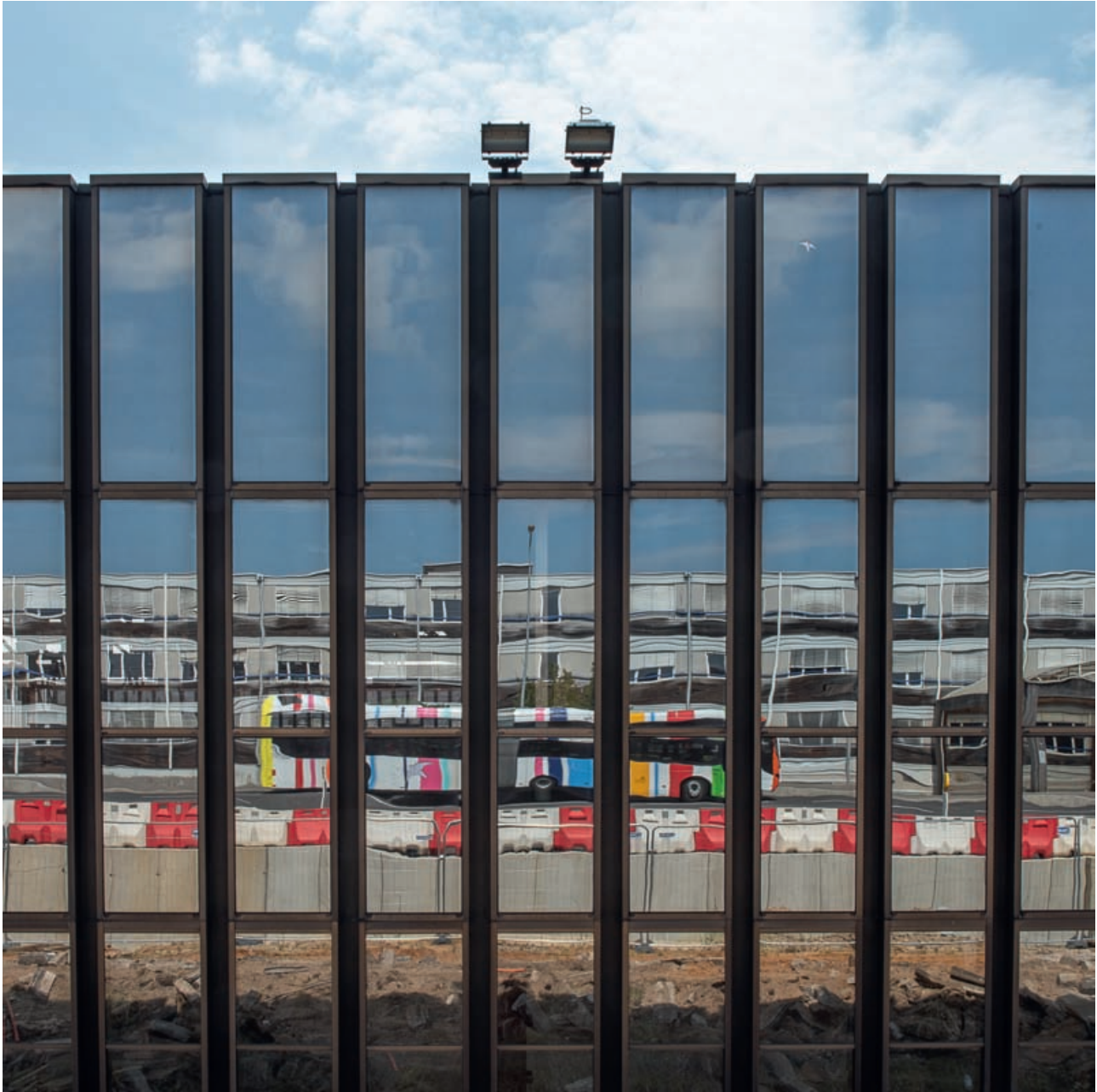
Υαλοπύλας του κτηρίου Ζαν Μονέτ, Luxembourg, 2018