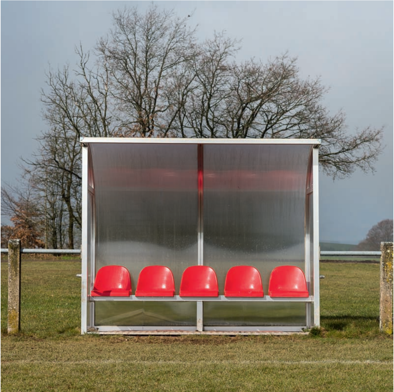
Πάγκος ποδοσφαιρικού γηπέδου, Brattert, 2018