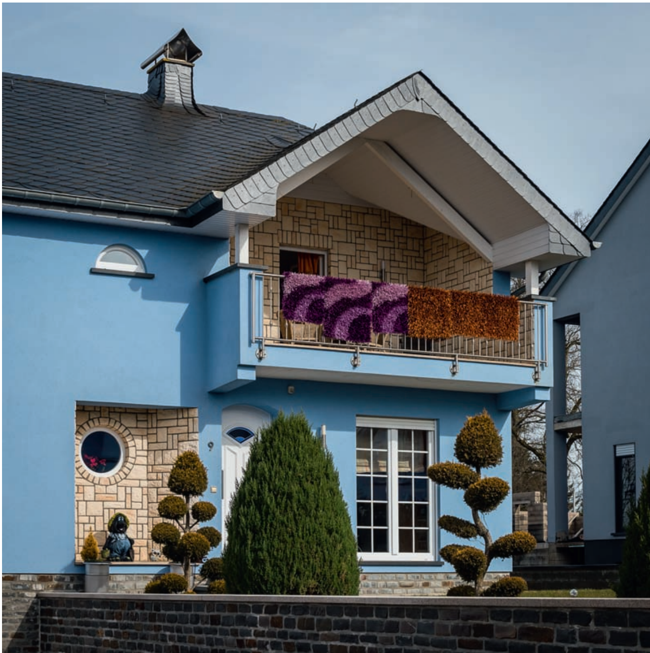
Γαλάζιο σπίτι ηρωινό Σαββάτου, Weiswampach, 2018