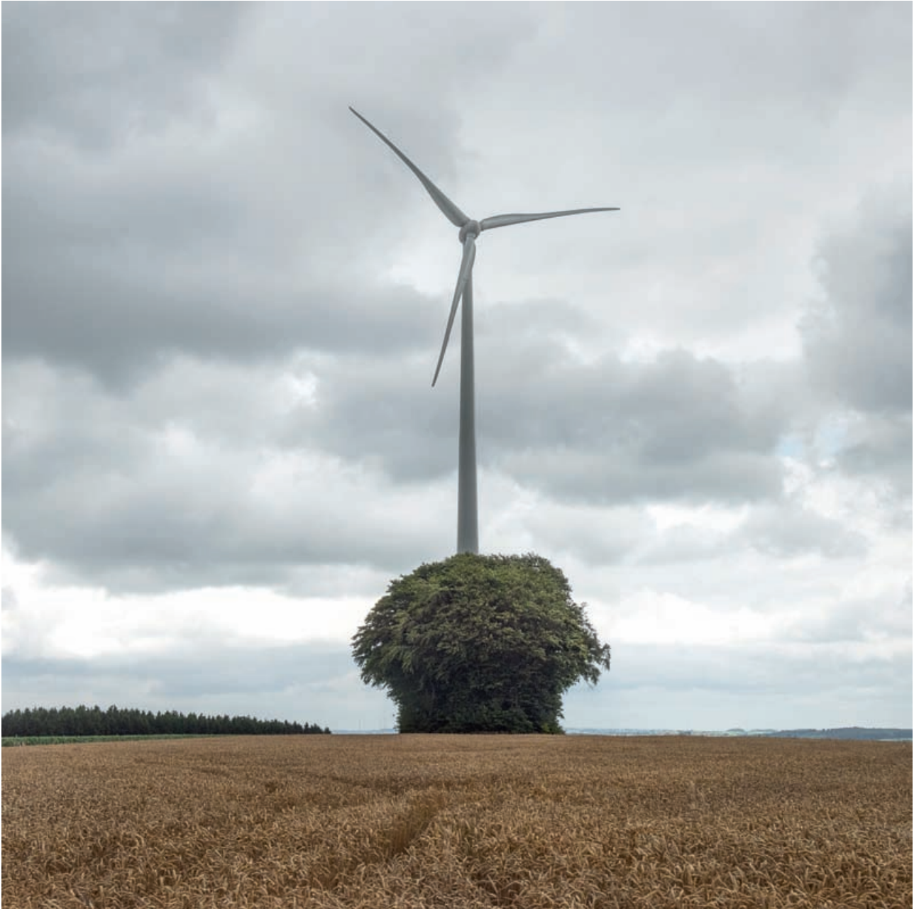
Η αιολική γλάστρα, Fischbach, 2018