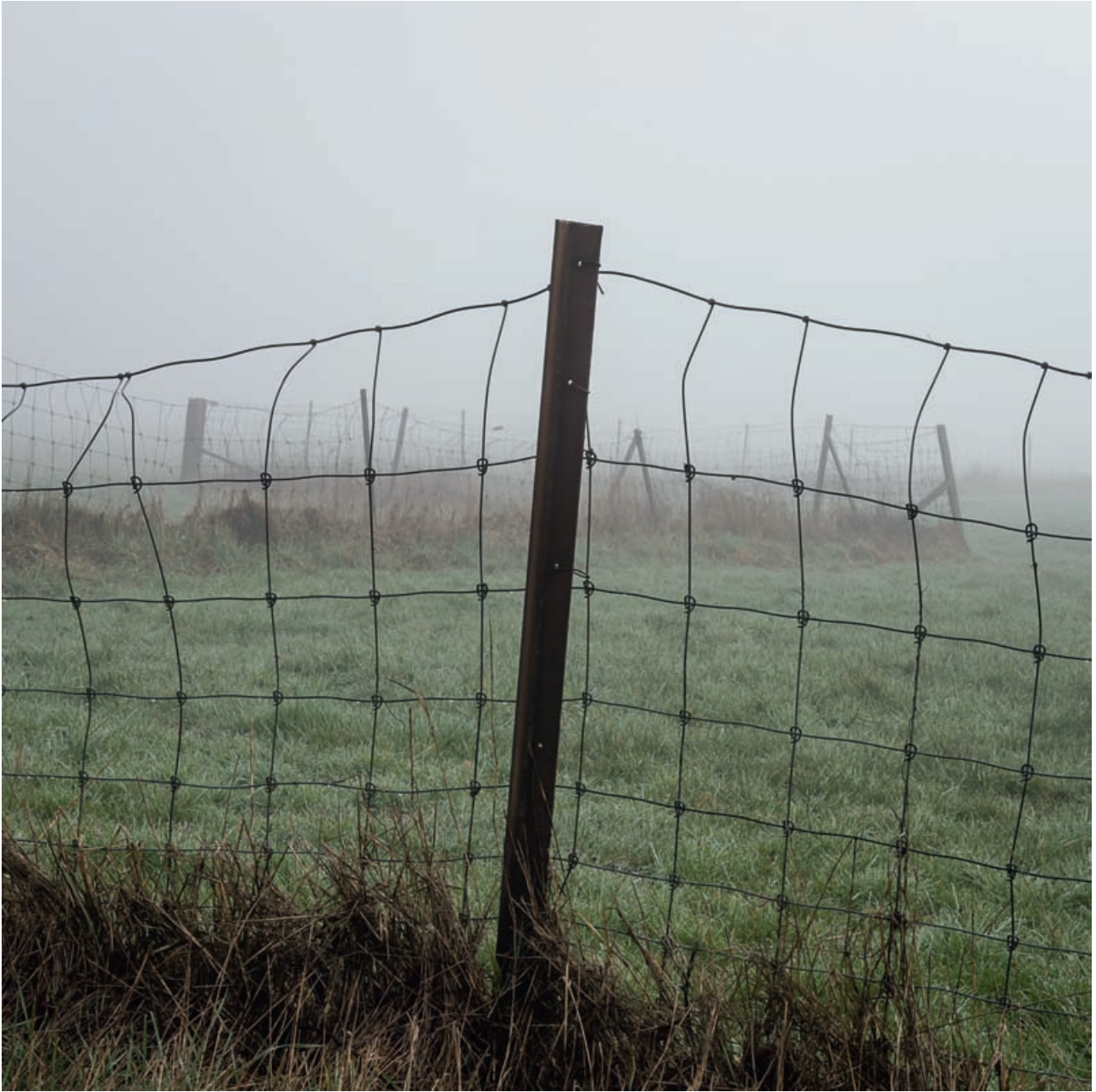
Περίφραξη αγρού νωρίς το πρωί, Tuntange, 2017