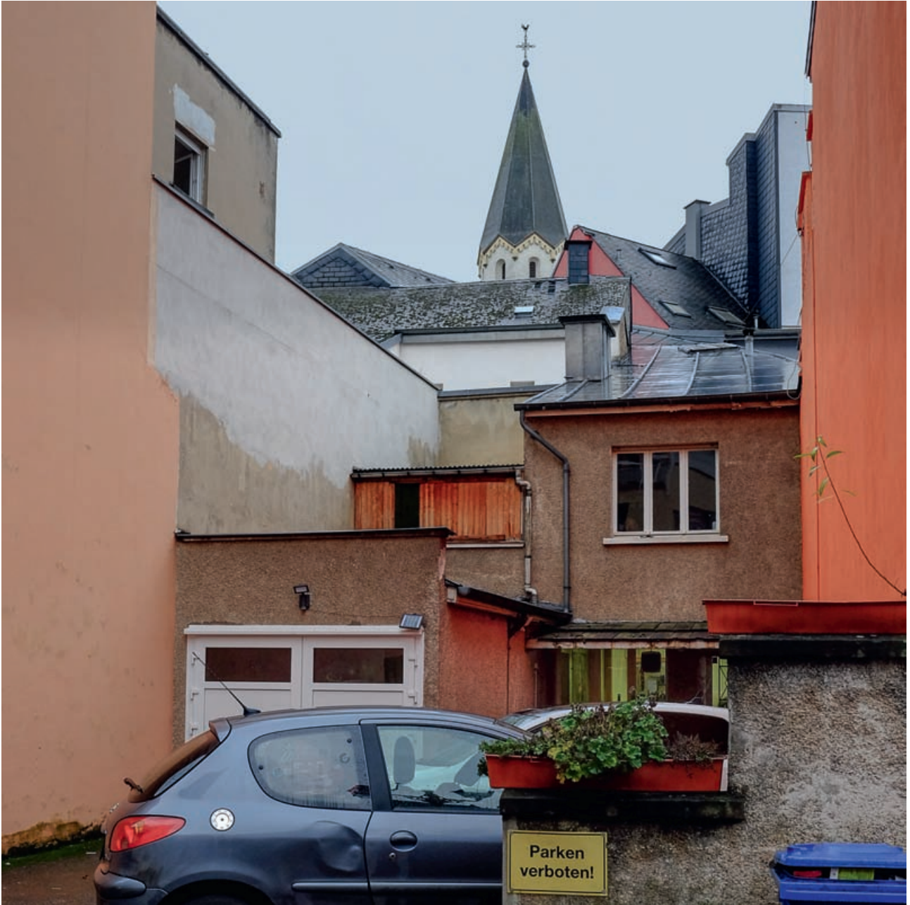
Σύνθεση με κατοικίες και καμπαναριό, Ettelbruck, 2017