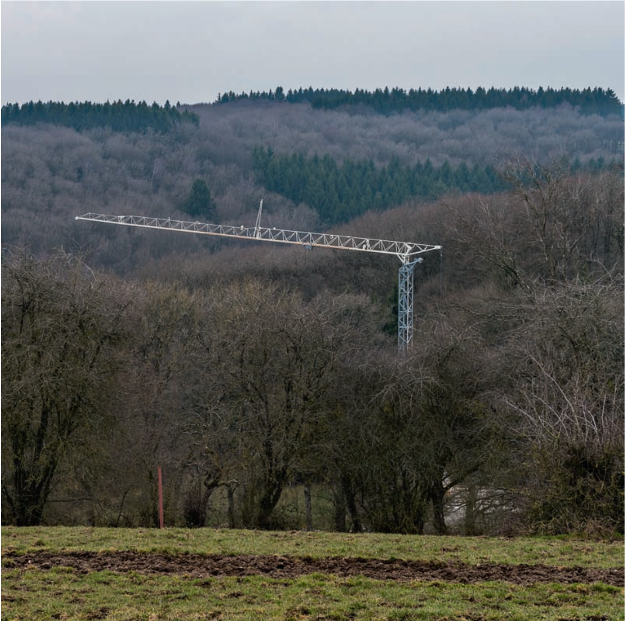
Κατασκευή στην άκρη του χωριού, Lehrhof, 2018